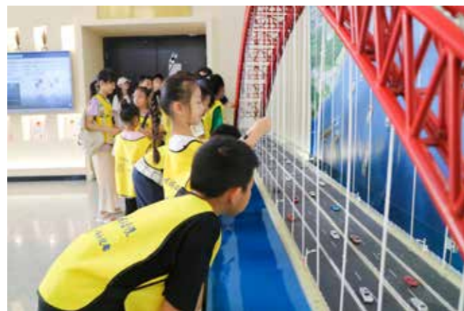
近距离观看拱桥模型