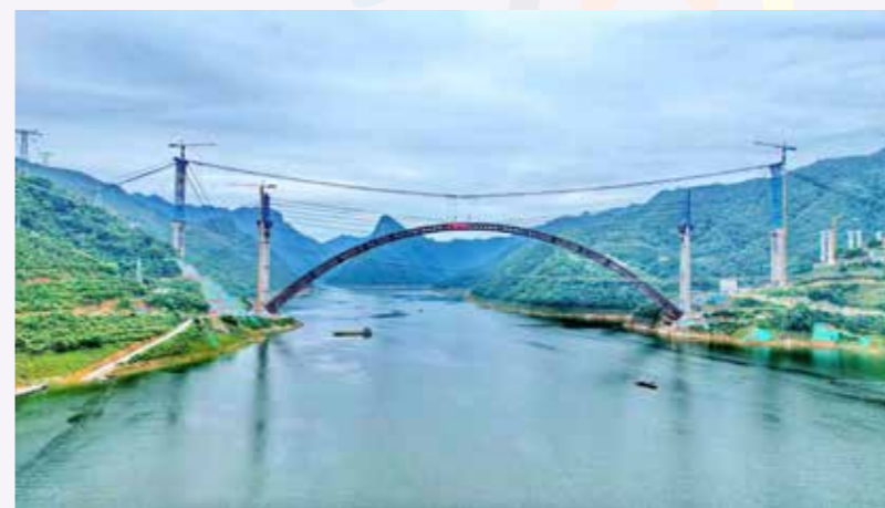
天峨龙滩特大桥远眺

平南三桥是建成通车的世界最大跨径钢管混凝土拱桥，实现了钢管混凝土拱桥设计理念、施工模式、关键技术等方面集中突破。郑皆连院士领衔的大跨拱桥关键技术研究团队研发了吊塔扣塔一体化设计及施工过程高精度主动控制体系，“地连墙+卵石层注浆加固”的大跨拱桥基础设计和处理方法及收缩补偿分时膨胀自密实管内高性能混凝土制备和检测关键技术等原创成果，实现了基于北斗卫星定位系统的智能千斤顶张拉控制塔架偏位由过去的分米级降为厘米级，大跨拱桥建设由山区向平缓河道深化推广扩展以及解决了管内混凝土后期脱粘脱空的工程顽疾。