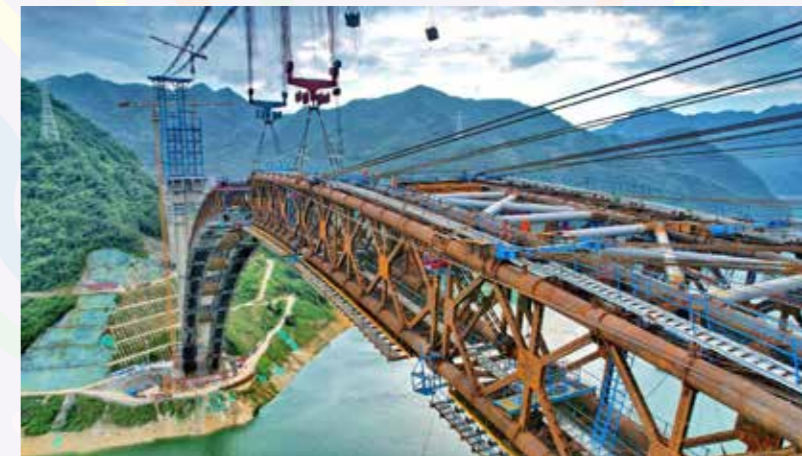
天峨龙滩特大桥施工现场